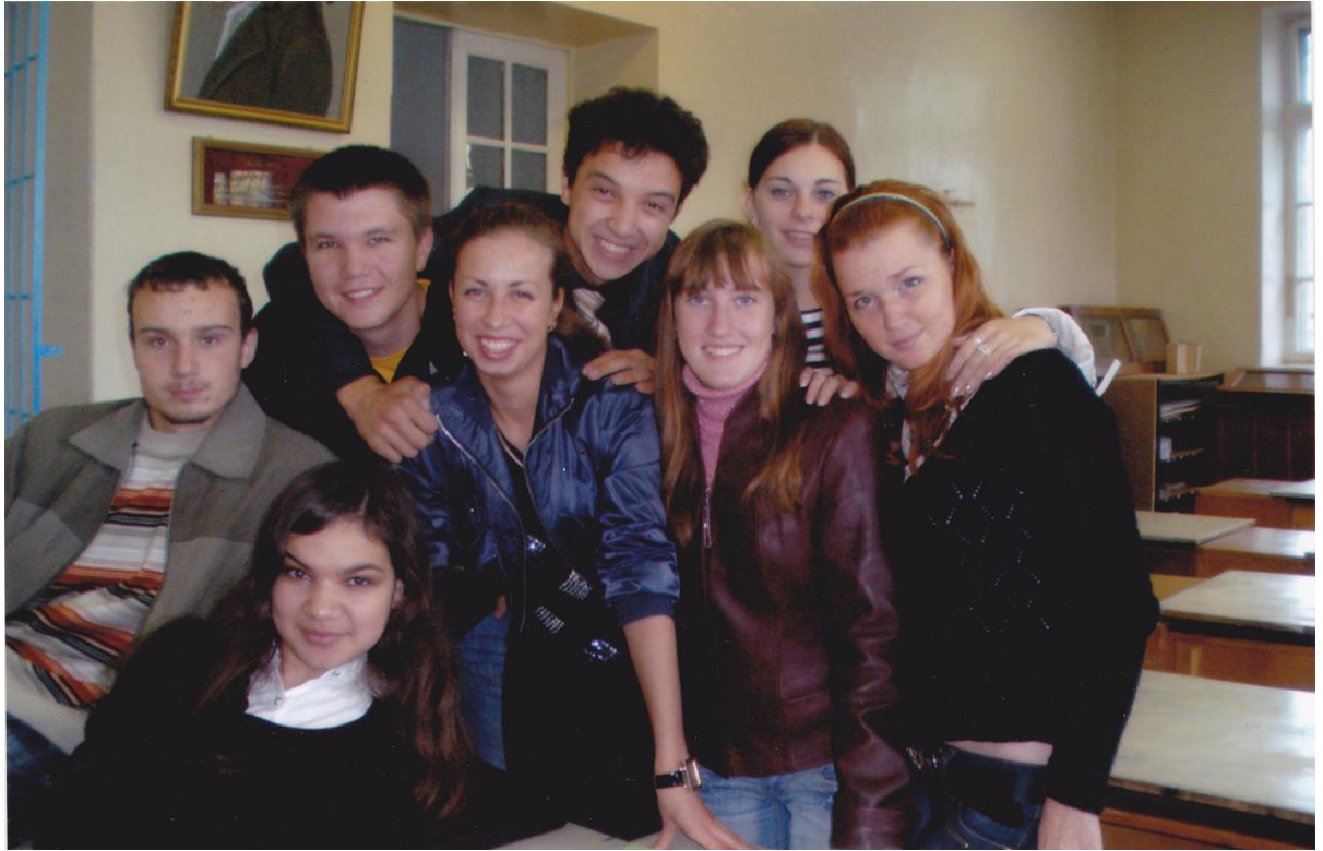
Севастопольський національний університет ядерної енергетики та промисловості