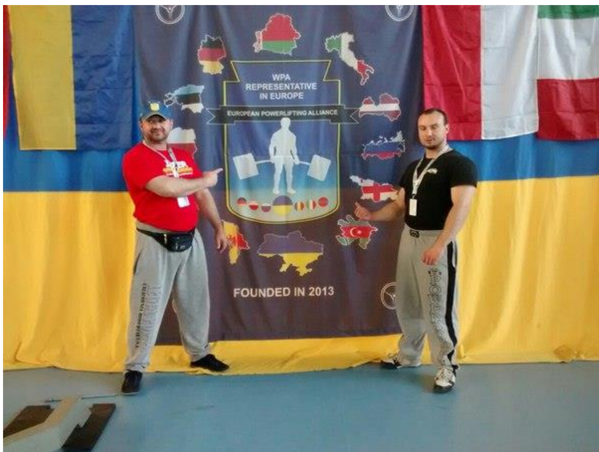
Під час проведення чемпіонату Європи, травень 2014р