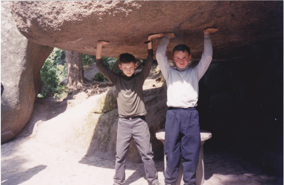
Експедиція до м. Умані