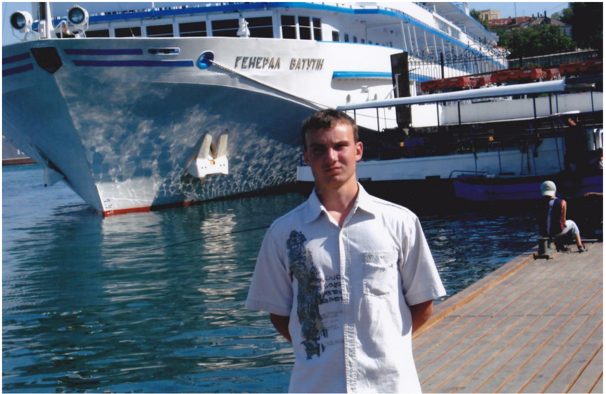
Під час навчання у м. Севастополі