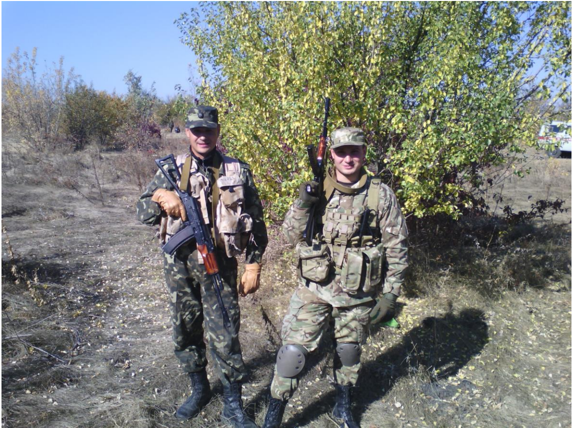
Під час виконання військового обов'язку у зоні АТО