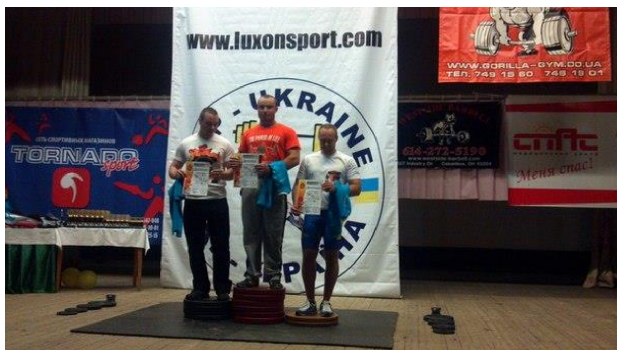
Перемога у турнірі фітнес клубу «Зірка»,2012р.