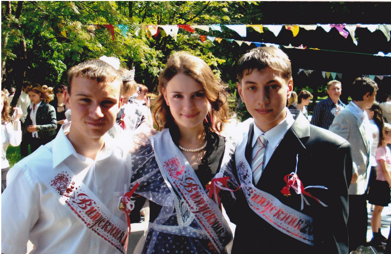
Випуск 2008 року