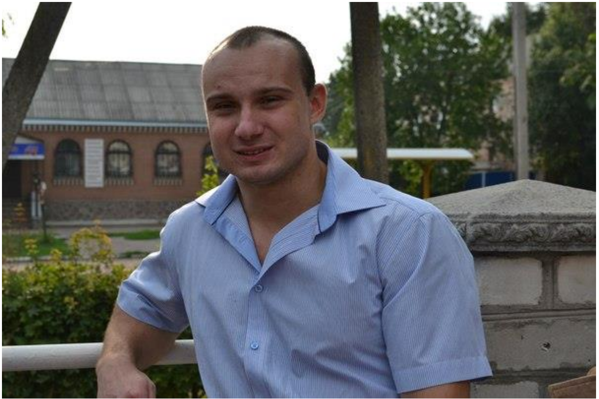
Через п'ять років після закінчення гімназії