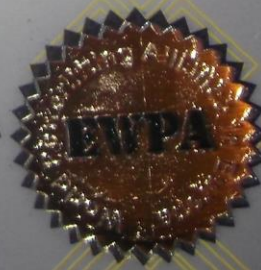
Сертифікат за зайняте I місце у чемпіонаті світу з пауерліфтингу, 2014р.