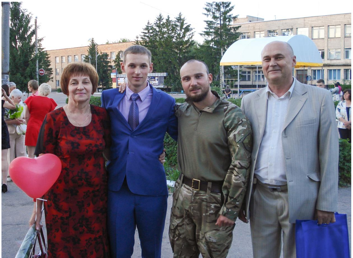
У родинному колі