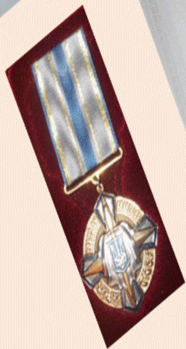
Бойові нагороди: медаль « За службу державі» нагрудний знак « За мужність і відвагу»