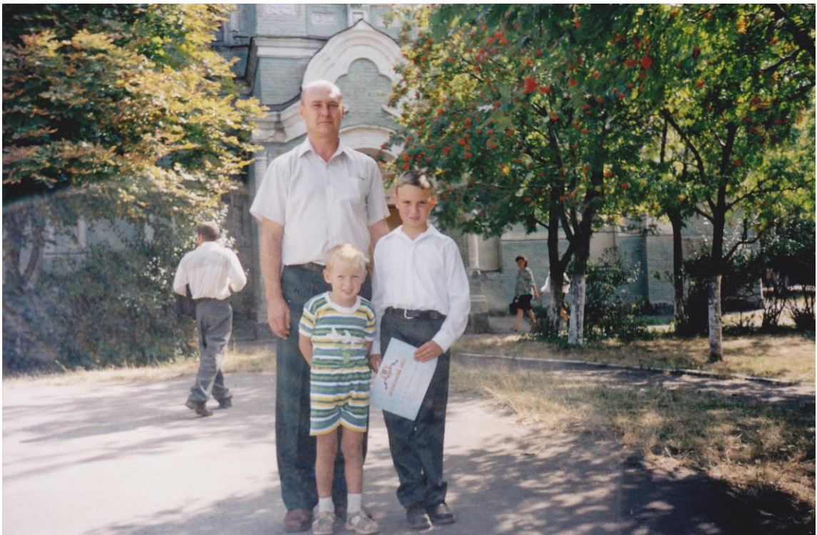
Нагороджений похвальним листом, за відмінні успіхи у навчанні