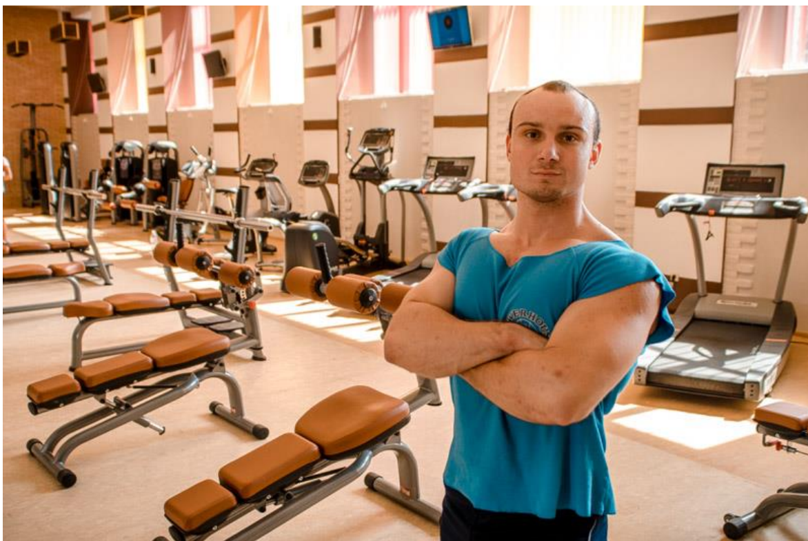
На відкритті фітнес клубу «Зірка»,серпень 2013р.