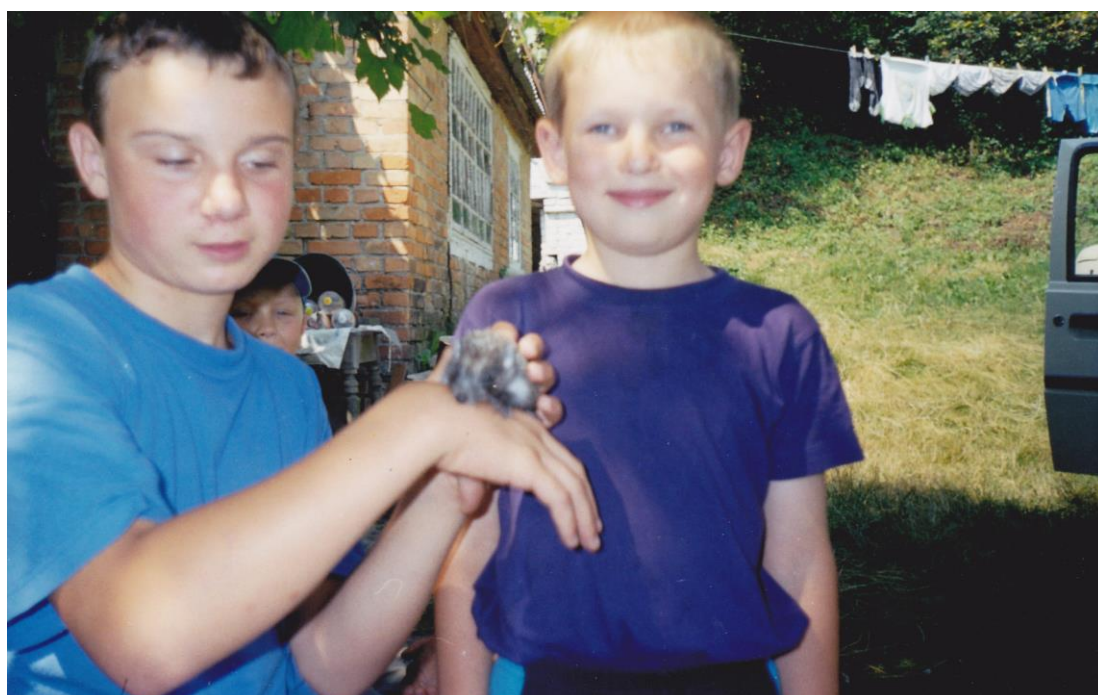
На відпочинку разом з братом