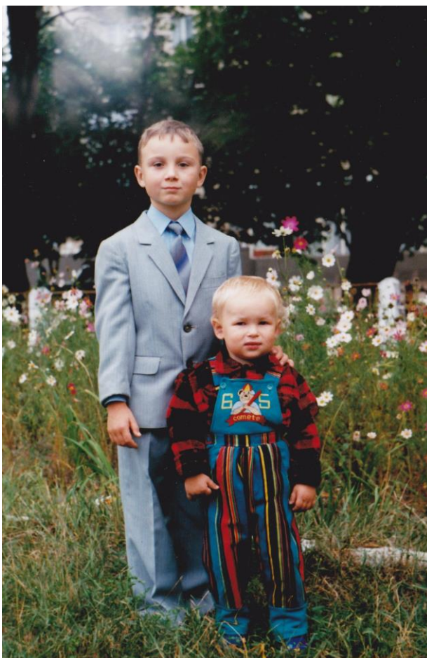
Перший раз у перший клас